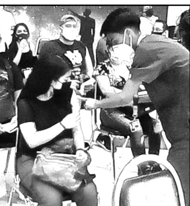
Se siguen buscando vacunas

Garza Villarreal señaló que el municipio tiene 600 trabajadores que apoyarán en la jornada, cabe